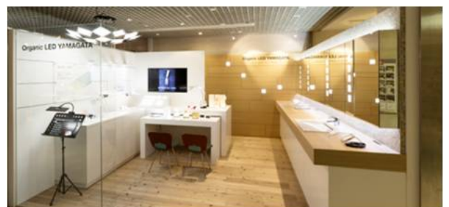
ショールーム「Organic LED YAMAGATA」