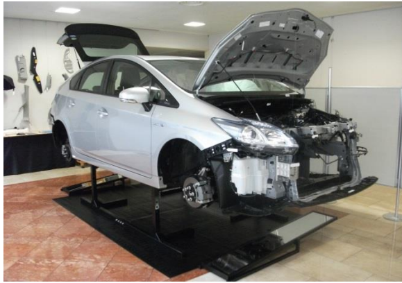
車両本体(3代目プリウス)